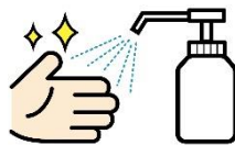
受付に消毒液の設置