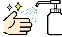
受付に消毒液の設置