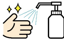
受付に消毒液の設置